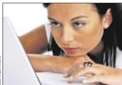
Was verraten die Sterne heute?

Glück in der Liebe, Stress im Beruf, ein tolles Sozialleben? Das aktuelle 14-tägige Horoskop gibt es für alle Fische-Damen, Löwinnen, Zwillinge, Jungfrauen & Co. auf der Seite www.fuer-sie.de . Gleich nachschauen – und bei negativen Sternen lieber wieder vergessen. (BM)